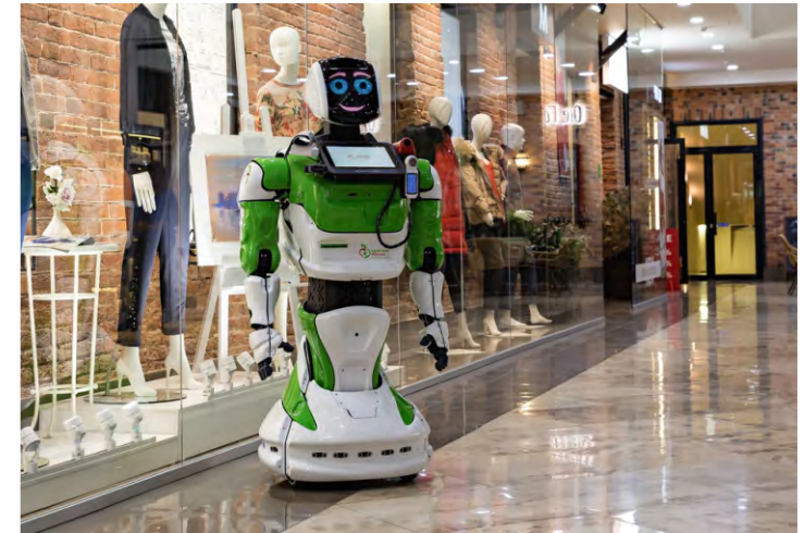
Офисы и торговые центры