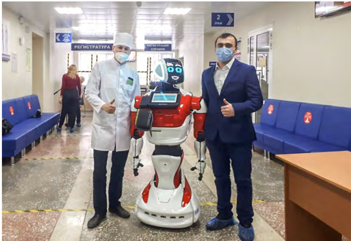
Клиники и аптеки

С помощью интерактивной диагностики он помогает вовремя обратить внимание на проблемы со здоровьем