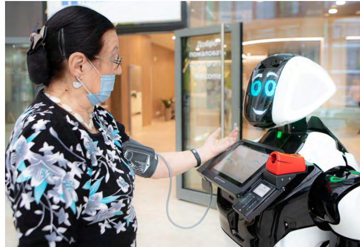
Вокзалы и аэропорты